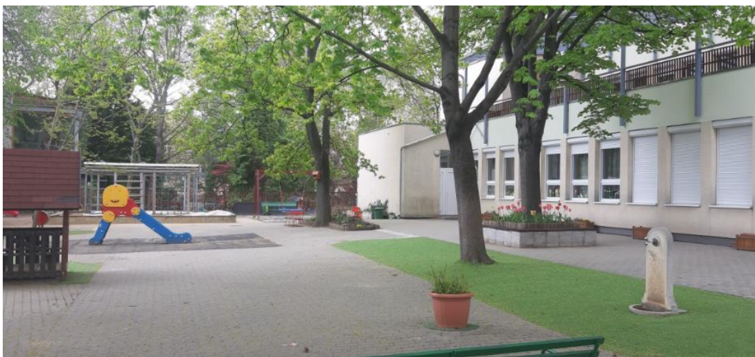
Szentimrevárosi Óvoda Székhely – Badacsonyi és Diószegi utcai épület udvara