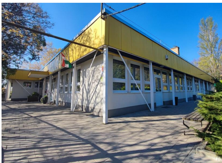
Szentimrevárosi Óvoda Alsóhegy Utcai Óvoda telephely épülete

Az óvoda egyedi arculata: Környezettudatos és egészséges életmódra nevelés