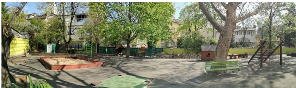
Szentimrevárosi Óvoda Újbudai Karolina Óvoda telephely udvara

Óvodánk négy csoportjához külön öltöző és mosdóhelység tartozik, ideális lehetőséget teremtve a gondozási feladatok végzéséhez. Pedagógiai céljaink megvalósítását segíti, hogy a meglévő helységeink mellett tornaszobával, és só fallal ellátott fejlesztő szobával is rendelkezünk.