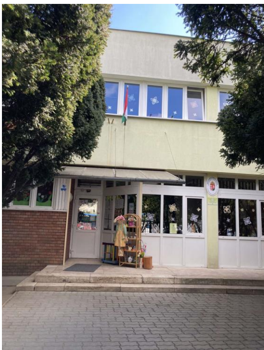
Szentimrevárosi Óvoda Újbudai Karolina Óvoda telephely épülete