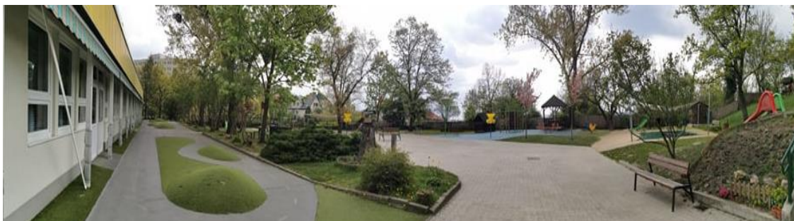
Szentimrevárosi Óvoda Alsóhegy Utcai Óvoda telephely udvara

Az óvodaudvar kertje ideális a gyermekek mozgásigényének kielégítésére. A már teljesen felújított udvarrészre új játékeszközök is kerültek, alájuk gumiburkolatot és műfüvet telepítettek. Ez az udvarrészünk párapaput is kapott, így a nagy nyári meleg itt elviselhetőbb lesz a gyerekek számára.