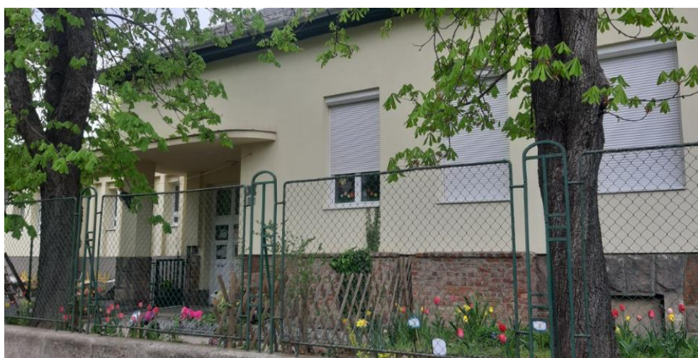
Szentimrevárosi Óvoda Székhely – Diószegi utcai épület

Az óvoda egyedi arculata: Komplex személyiségfejlesztés a közösségben