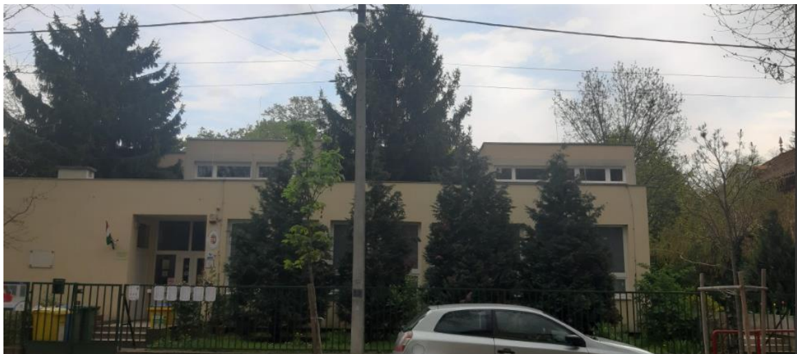
Szentimrevárosi Óvoda Székhely - Badacsonyi utcai épület